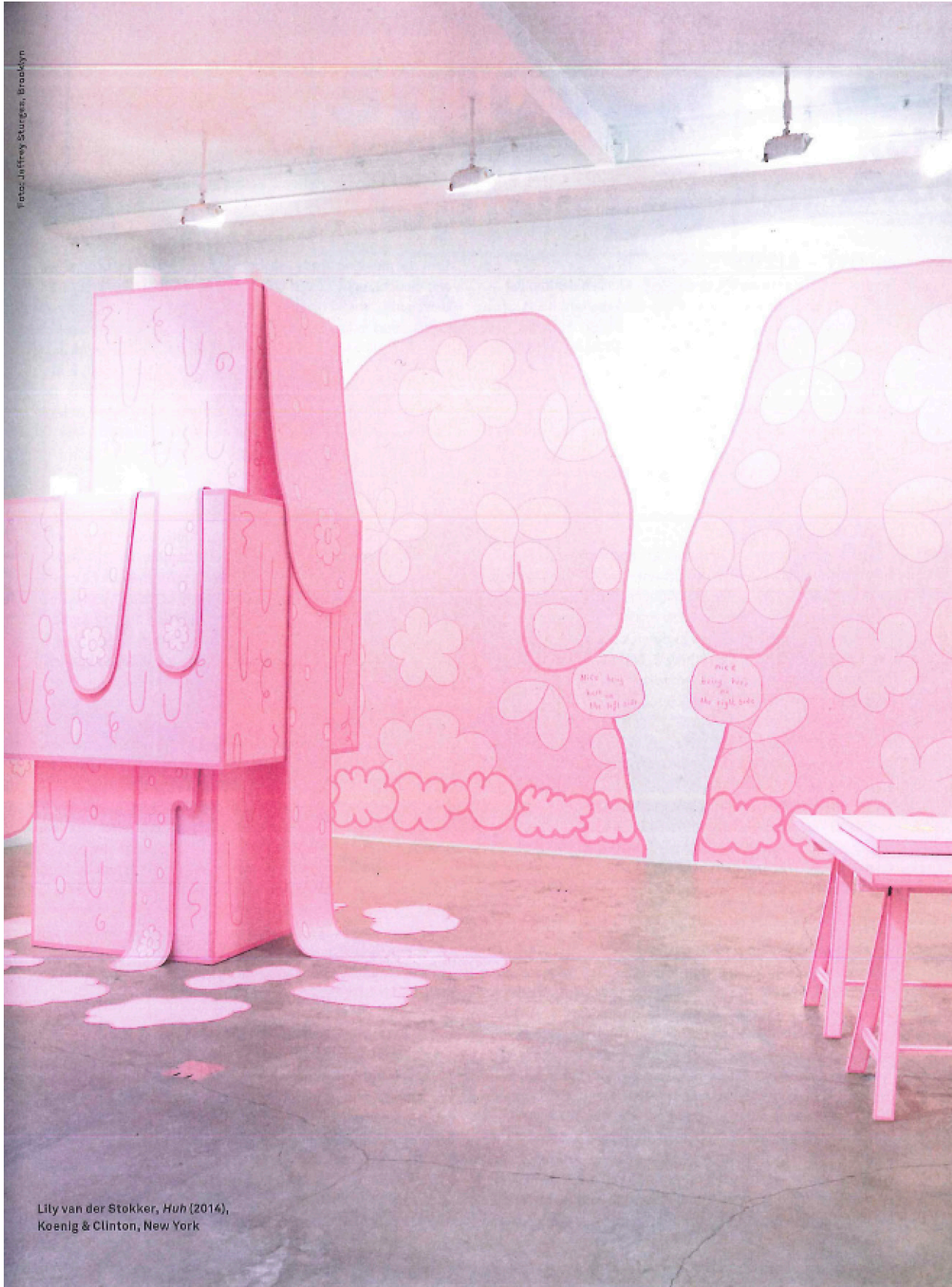
Lily van der Stokker, Huh (2014), Koenig & Clinton, New York